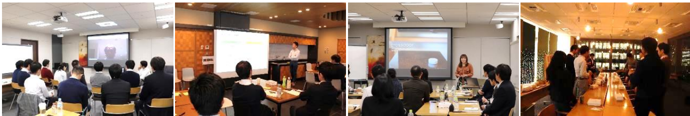
※写真は2019年度の様子

約2か月の学習→実践→内省のサイクルと、異業種・異職種のチームメンバーとの議論を通じて、自らの足らずを知り「イノベーション×リーダーシップ」の観点から自己成長の課題を明確にする